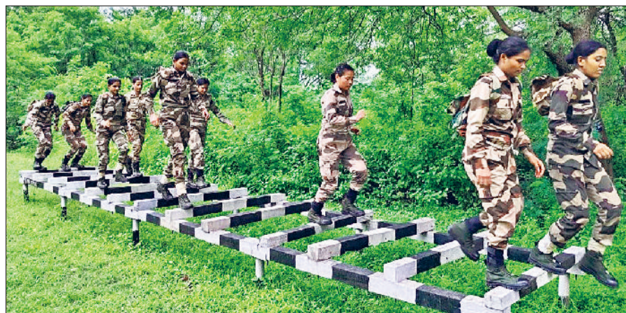
झंझर। प्रशिक्षण शिविर में भाग लेते हुए महिला प्रशिक्षणार्थी।

शुरू हो गया है। यह आठ सप्ताह का कोर्स महिला कमियों को उच्च