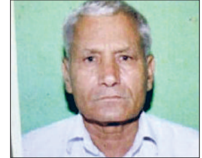
दिवंगत मानसिंह का फाईल फोटो