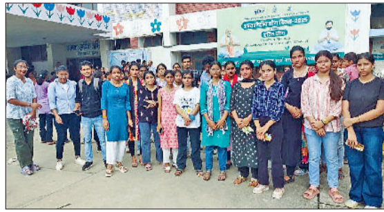
झज्जर। बिजली-पानी की मांग को लेकर लघु सचिवालय पहुंचे विद्यार्थी व संस्थान परिसर में रोष प्रकट करते हुए विद्यार्थी।

विद्यार्थी संख्या अधिक रहने के कारण आधे दिन में ही पानी खत्म हो जाता है जिस कारण पेयजल की समस्या भी बनी रहती है। लड़कियों के लिए बनाए गए एकमात्र वॉशरूम में भी लीकेज के कारण दिनभर पानी बबाद होता रहता है ऐसे में छात्राओं को परेशानी आती है। प्री पीरियड के समय विद्यार्थियों के बैठने के लिए भी पर्याप्त व्यवस्था नहीं है। यदि वे बाहर जाकर बैठते हैं तो वहां मच्छरों की