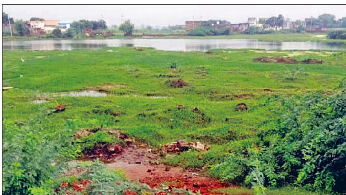
झज्जर। माजरा दूबलधन गांव का खेल स्टेडियम।