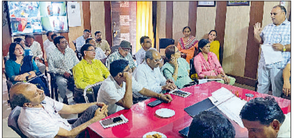
झज्जर। समीक्षा बैठक में उपस्थित शिक्षक।