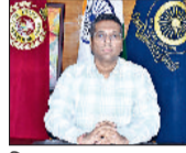
जिला उपायुक्त स्वर्णिल रविन्द्र पाटिल।

ये आदेश 29 सितंबर 2025 तक प्रभावी रहेंगे: जिलाधीश