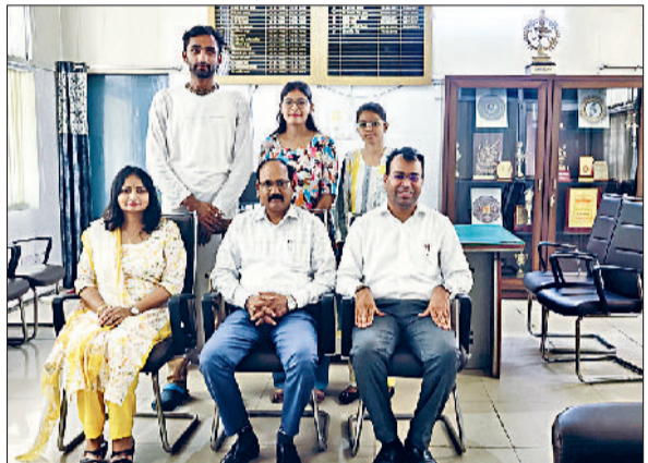
झज्जर। होनहार प्रतिभागी महाविद्यालय स्टॉफ सदस्यों के साथ।