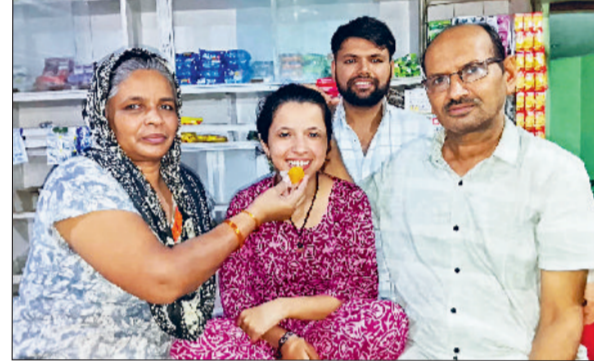
बहादुरगढ़। प्रियंका का मुंह मीठा करते परिजन।